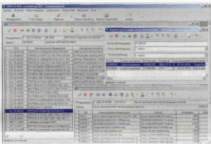
Журналы дефектов, наработки, учета работ по нарядам

На Смоленской АЭС в настоящее время эксплуатируются три энергоблока с реакторами РБМК-1000, информационная база предприятия насчитывает 212 тыс. единиц оборудования. Станция имеет территориально распределенную инфраструктуру, состоящую из множества зданий и сооружений различного назначения. Для решения задач безопасной и надежной эксплуатации столь сложного и потенциально опасного производственного объекта требуется комплекс мер по управлению его состоянием, его контролю и прогнозированию. Повышение эффективности этих мер руководство станции связало с внедрением информационной системы поддержки управления эксплуатацией АЭС на базе комплекса TRIM, который по составу функций соответствует управ-