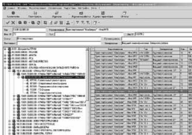
Рис. 1. Каталог оборудования